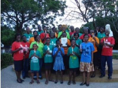
Amigos de SVD- Ghana "compartan su luz" después de una Misa Dominical de Vocación en Abril 2016

Los Amigos de SVD (FOS) en la Parroquia Santa María Margarita Dansoman Accra-Ghana fue inaugurado en las ordenaciones de sacerdotes en Agosto 2009, el cual fue localizado en la parroquia. La iniciativa fue tomada por el sacerdote asistente de la Parroquia, con el apoyo del Párroco. Miembros de la parroquia fueron motivados a incorporarse al grupo. Ahora el grupo tiene 34 miembros.