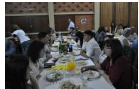
Cena africana para recaudar fondos

PARA ENTREGAR INFORMACION Y FOTOS PARA OTROS EDICIONES EN EL FUTURO POR FAVOR DE ENVIAR A CUALQUIERA DE LAS EDITORIAS: