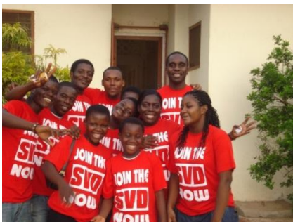
"Join SVD now" Miembros jóvenes después de una obra teátrica durante una Misa Dominical de Vocaciones