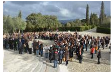
Peregrinación a Fátima con los SVD Amigos

Fecha límite para enviar información para la próxima publicación será el Viernes, 21 de octubre 2016