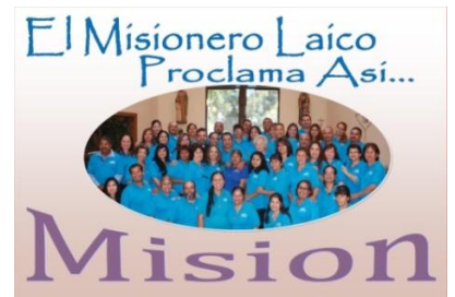
Misioneros Laico Del Verbo Divino En Riverside, California (USA)