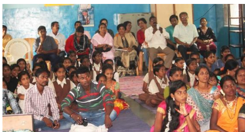
Interacción con los niños de los tribus y miembros del grupo de auto ayuda

Además de las actividades sociales, damos prioridad para nuestro crecimiento como discípulos. Sesiones de crecimiento psico-espiritual se organizan regularmente por los miembros. Nuestras reuniones regulares no sólo nos han servido para profundizar el vínculo interpersonal entre nosotros, sino que también nos han ayudado a los miembros a conocernos mejor, y de manera significativa involucrarnos en la vida del otro cuando sea necesario.