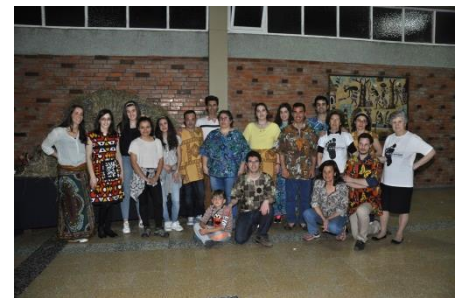
Miembros del grupo de Diálogos