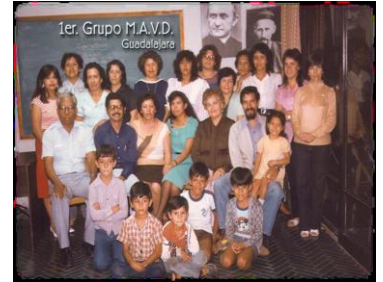
Los "Misioneros Auxiliares" de 1982 Fundado en Guadalajara, Jalisco, Mexico.